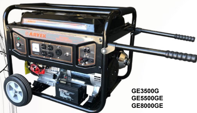
GE3500G GE5500GE GE8000GE