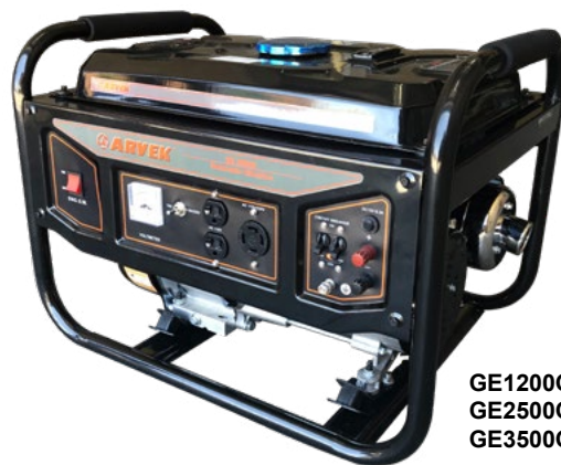
GE1200G GE2500G GE3500G